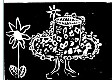
Eine Auswahl an Schülerarbeiten, die auf der Wernissage gezeigt werden.

Werner-von-Siemens-Gymnasium Herzog-Wilhelm-Str. 25 38667 Bad Harzburg Telefon: 05322-9623-0 Fax: 05322-9623-45 http://www.wvsharzburg.de E-Mail: siemens.gymnasium@landkreis-goslar.de